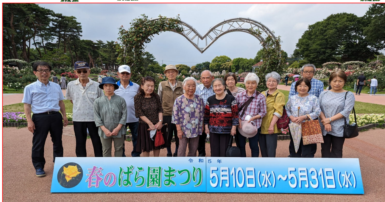
春のばら園まつり 5月10日(水)~5月31日(水)