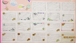
寿楽園のみなさまへ