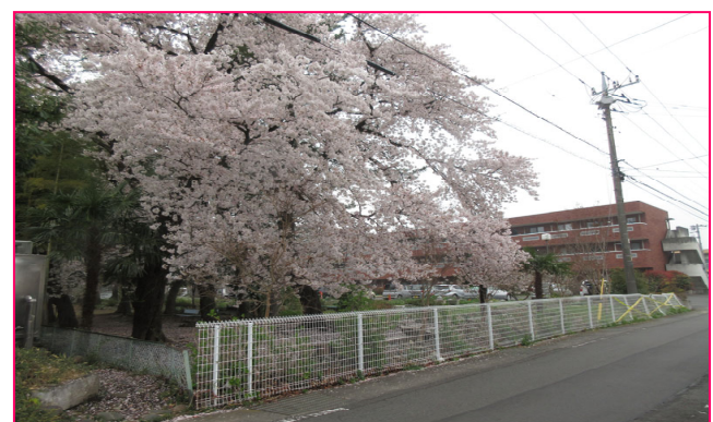
🌸園庭の桜も見頃です🌸