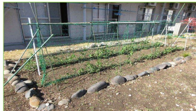
🌱中庭でえんどう豆を育てています。楽しみです🌱