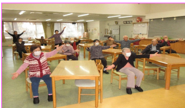
☺カラオケ体操 皆元気です☺

何でも好きな物食べてね♡ おにぎりは何味がいいですか？ お稲荷さんは、何個ですか？