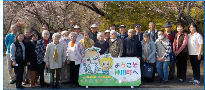
世界遺産 高山社跡の 見学もしました。