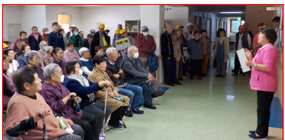
水害想定訓練を行いました。(27日)