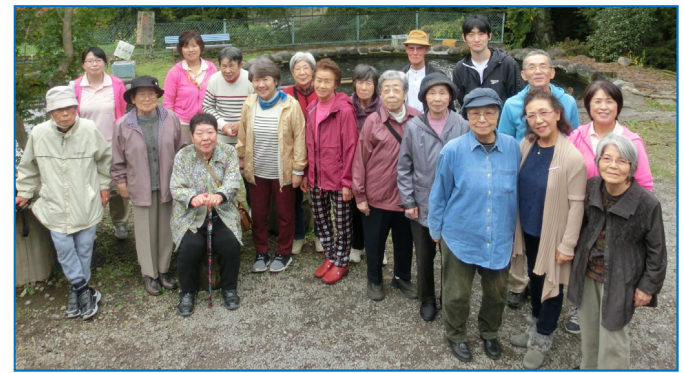
美味しいりんごはあるかな？