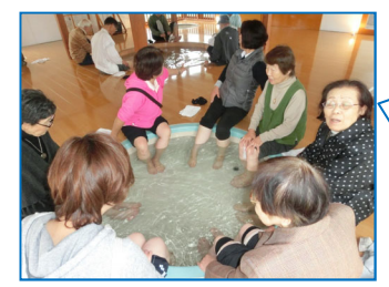
みんなで 一緒の足湯は気持ちいいね。