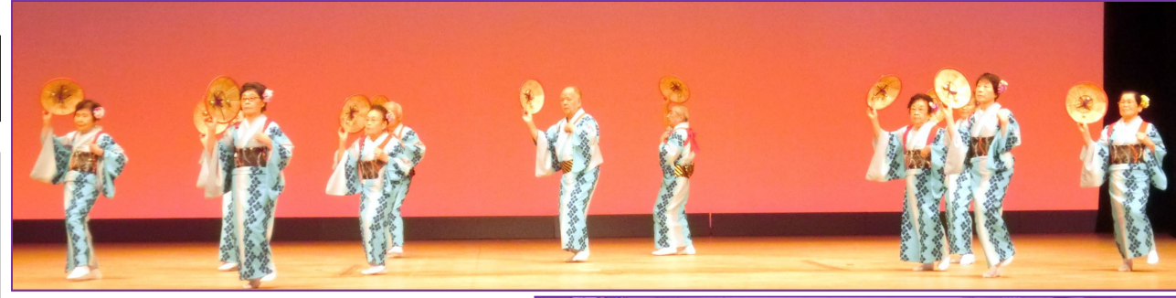
民謡民舞発表大会(15日) 会場から大きな拍手をいただきました。 (前橋市民文化会館)